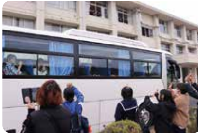
最後のお別れ。また会えますように