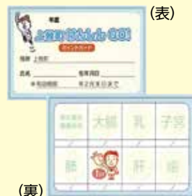
(裏) ポイントカード

3ポイント貯まりましたら、ポイントカードをお持ちになり上記窓口で申請してください。