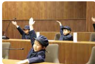
「はいっ！！」と元気よく挙手する園児たち