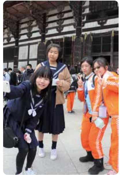
東大寺の大仏大きかったね！