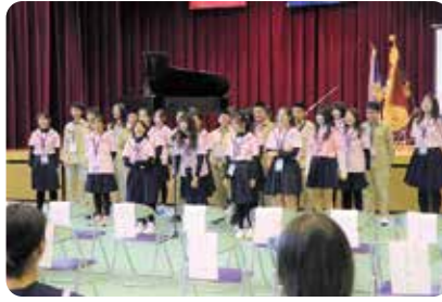
入町式で合唱を披露する桃園國民中學の生徒たち

国際社会で活躍するグローバル人材の育成の推進を目的として、台湾桃園市立桃園國民中學との国際交流が12月13日～15日まで行われ、期間中桃園國民中學の生徒たちは上牧中学校と上牧第二中学校の生徒の家庭でホームステイをしながら一緒に登校して授業を受けたり、浴衣体験や奈良市に行ったりするなど、日本文化に触れたひとときを過ごされました。退町式終了後、生徒たちは一緒に記念撮影や連絡先を交換し、別れを惜しんでいました。