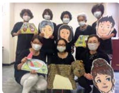
いきサポ座の皆さん