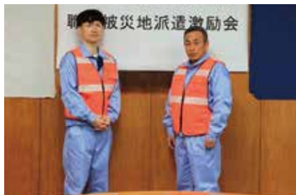
派遣された2名の職員