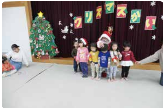
12月クリスマス会の様子