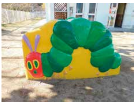
第1保育所に新しく導入された遊具