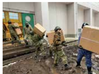
救援物資を運ぶ自衛隊の皆さん