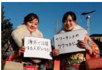
「海外で活躍する人材になる！」 「フリーランスのケアマネジャー」