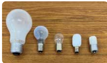
これらは燃えないごみです

LED照明、白熱電球は有害ごみではありません。これらは燃えないごみとなりますので、町指定の燃えないごみの袋（緑色）に入れて、燃えないごみの収集日に出してください。また、下記のような有害ごみについては、町内3箇所に設置されている有害ごみボックスへ入れてください。