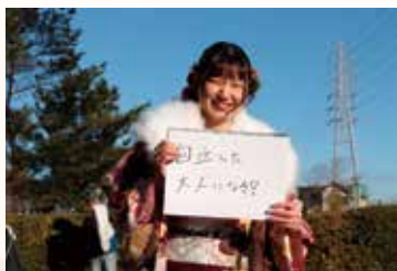
「自立した大人になる！」