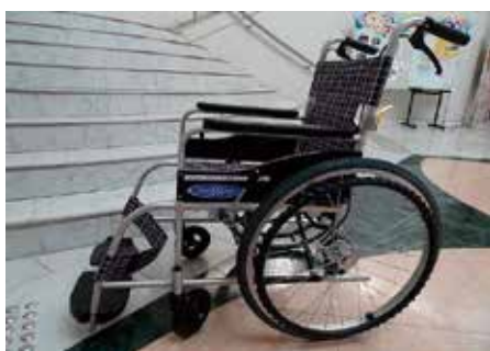
2000年会館に新たに導入された車いす