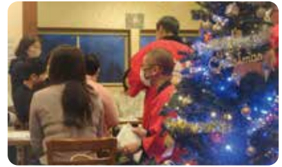
盛り上がるイベント会場 (陽だまりカフェ)

上牧町主催の出会い交流イベント『クリスマス婚活パーティー!』が昨年12月16日開催され、男女21名が参加。「陽だまりカフェ」さんのご協力のもと、素敵な空間やケーキ等をご用意いただきました。参加者は、ビンゴ大会やクリスマスソングで盛り上がり、特定非営利活動法人かんまきマリッジサポート・赤い糸のサポーターのさりげない後押しで会話も弾み、3組のカップルが誕生しました。