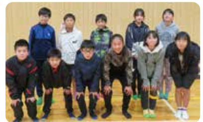
皆さん応援してください!

3月2日(土) 榎原運動公園で開催される、「第19回市町村対抗子ども駅伝」に参加する小学生11人が、昨年の順位やタイムを超えられるよう、監督とコーチの指導の下、日々トレーニングに励んでいます。