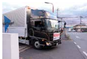
救援物資を載せ被災地へ向かうトラック

北葛城郡4町（上牧町、王寺町、広陵町、河合町）は、奈良県のカウンターパート支援先である石川県穴水町へ、4町が備蓄している物資を届けるため、1月16日、広陵町役場玄関前で救援物資輸送出発式を行い、救援物資を載せた車は穴水町に向け出発しました。