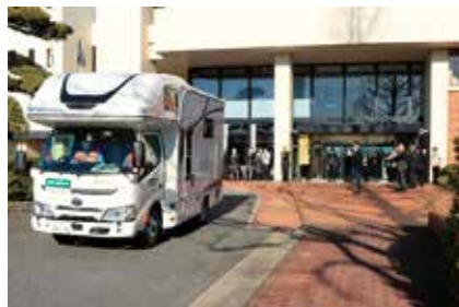
1月17日午前9時30分 上牧町役場前を出発しました