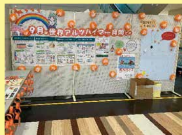
啓発展示 (ラスパ西大和店)