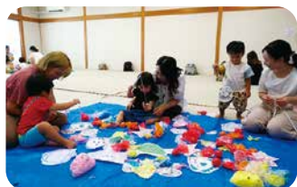
9月10日 うさぎクラスの様子