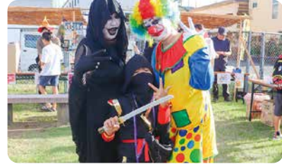
仮装に身を包む地域の皆さん（服部台）

町内の自治会による秋祭りが米山自治会、服部台自治会、南上牧自治会で開催され、地域の子どもから大人までたくさんのかたで賑わいました。