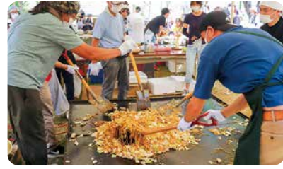
スコップで焼きそばを焼く（米山台） ※調理用に清潔なものを使用しています。