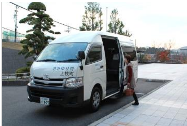
※写真はささゆり号

通学部会資料No.6「自転車通学の検討について」において、自転車通学を導入する方向で検討する場合、コミュニティバスの利用に関する検討よりも自転車通学導入のための検討を優先して進めていくこととなりますが、安全面などの問題から自転車通学の導入を見送る場合、通学が困難な地区に対し、 コミュニティバスを活用した通学支援の検討が必要 になります。