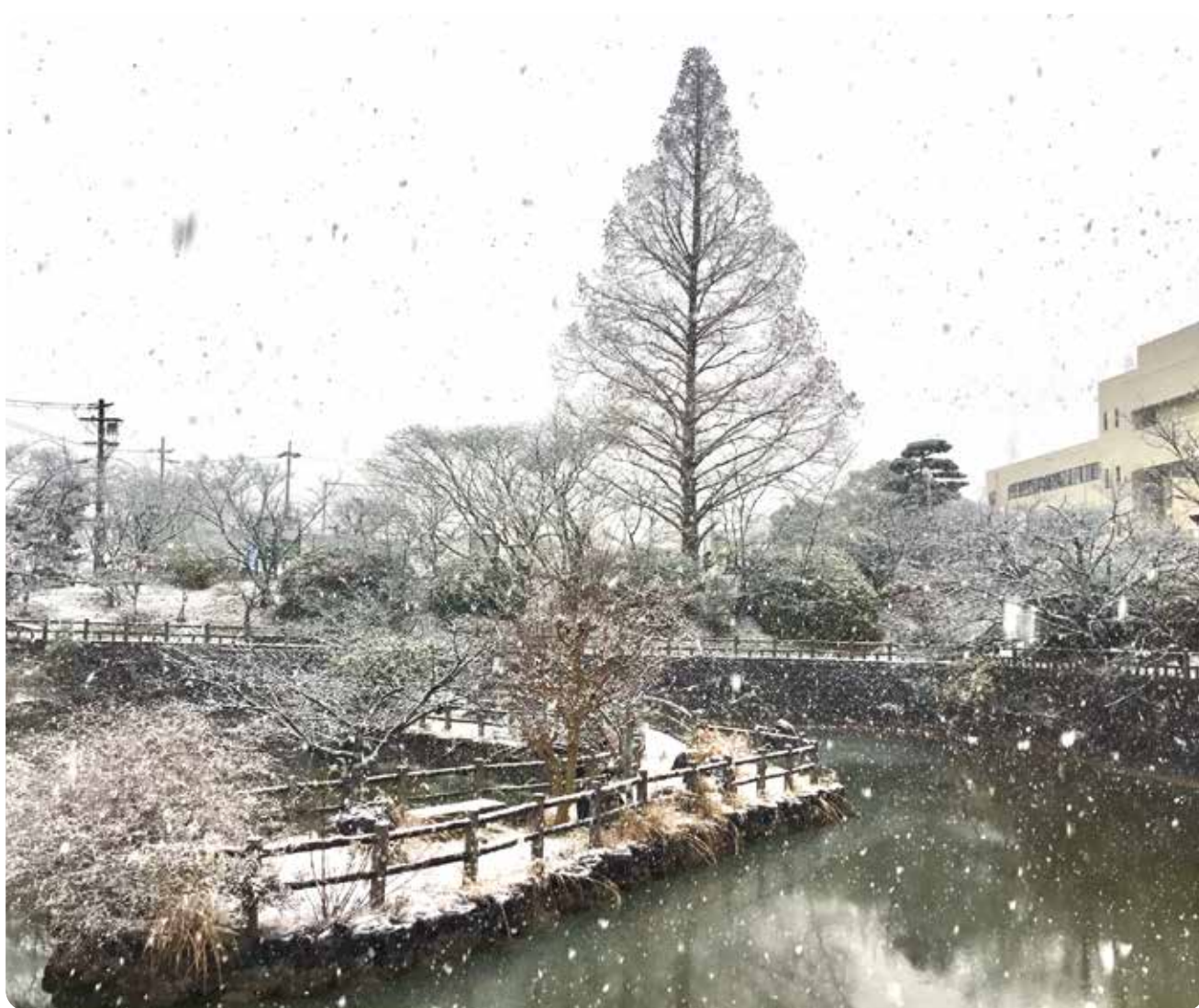
雪に染まる上牧町役場