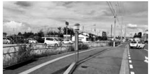
ベンチ設置予定箇所

答 設置場所は、米山新町線の大型店舗周辺の住宅や介護施設、2000年会館等の主要施設が集中する区域である。2か所に路線バスのバス停が存在し利用者の休憩場所が必要と考える。各施設の利用者や周辺住民の利便性を図り、バス停で待つ高齢者等が利用できる環境を確保するためにベンチを設置するための費用である。