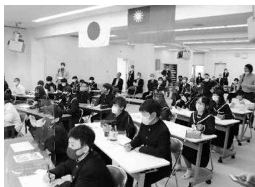
上牧中学校の様子(10月27日)