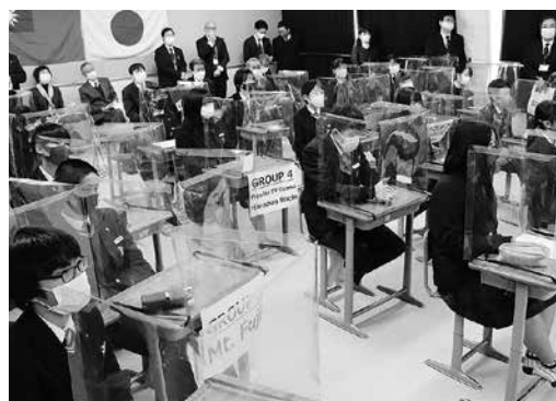
上牧第二中学校の様子(12月22日)