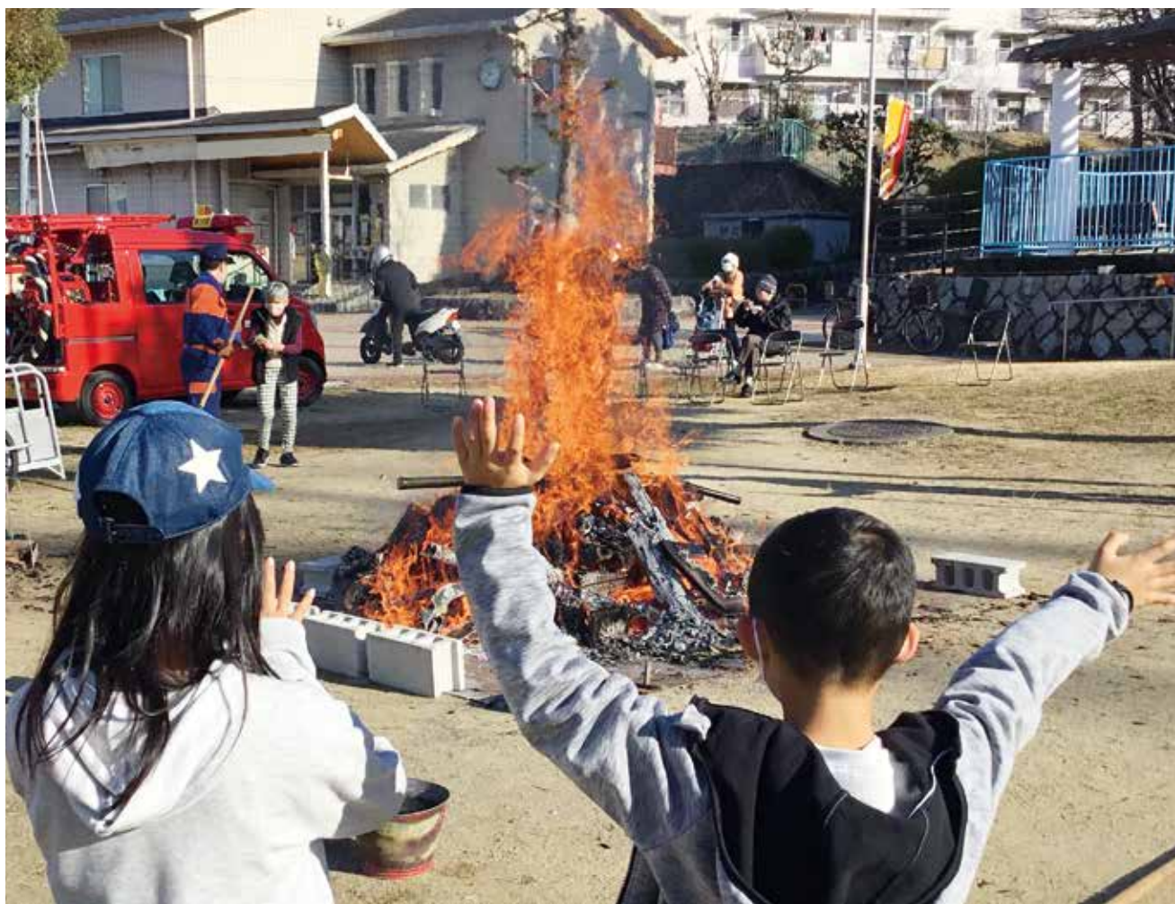
片岡台3丁目のとんど焼き