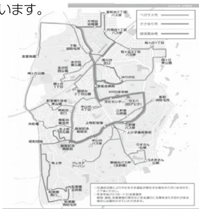
コミュニティバス運行図

答 令和5年度の服部台明星線全面開通に合わせ令和4年度にルート等の見直しを行い開通と同時に新しい運行が出来る方向で検討を進めていきたいと考えています。