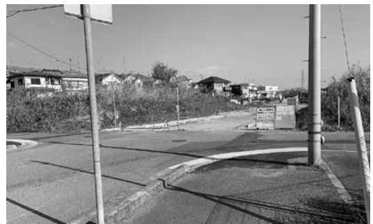
工事中の町道服部台明星線

答 服部台と履物団地交差点に信号機設置を要望していますが、警察署の見解では無理との事です。服部台明星線と下牧高田線交差点には信号機は設置されますが、履物団地出入口交差点等の安全対策が必要です。専門家等の意見や指摘等も参考に約1年かけて対策を講じてまいります。