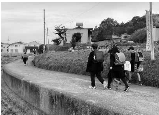
元気に登校する子どもたち 12月16日松里園地域付近

答 当該町道は通学路でもあるので、児童生徒の安全を確保するため早急に修繕、補修を行いたい。