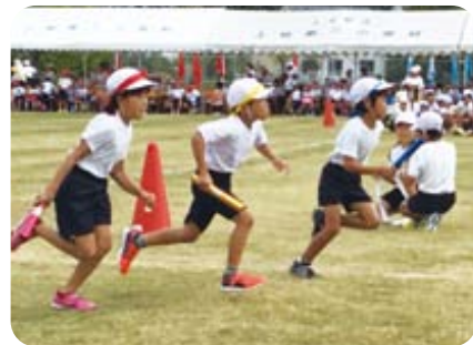
秋風そよぐ中、体育大会・大運動会