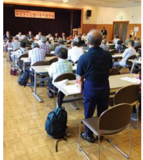
2000年会館2階多目的室にて

今後も議会基本条例に示す「開かれた議会」を目指し、議会報告会を開催して参りますので、一人でも多くの町民の皆さまに関心を持って、参加して頂けることを願っています。