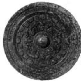
画文帯環状乳神獣鏡 (上牧久渡3号墳出土)

上牧久渡古墳群最北に位置する上牧久渡3号墳から鉄製武器類や土器とともに出土した中国鏡。