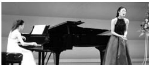
ペガサスホールがオペラハウスに(8月11日)