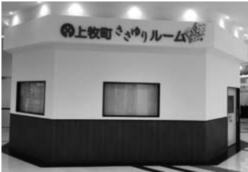
新しくなったささゆりルーム (アピタ西大和店 2階)