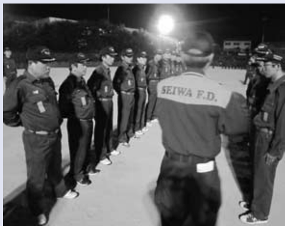
団長指揮のもと礼式訓練を受ける団員の皆さん

このほど健民グラウンドで消防団員基礎訓練が行われました。この訓練は、西和消防組合南分署の協力を得て、上牧町の消防団員として活動するための基礎知識や技能の修得と地域防災の担い手としての任務を自覚熟成するために行われたものです。6月から8月にかけて四回にわたって夜の8時から実施された訓練では礼式訓練や消火作業が必要となるホースを使った訓練などが実践さながらに行われました。休日にも関わらず多くの消防団員が参加され、教官の指導のもと熱心に訓練を受けておられました。