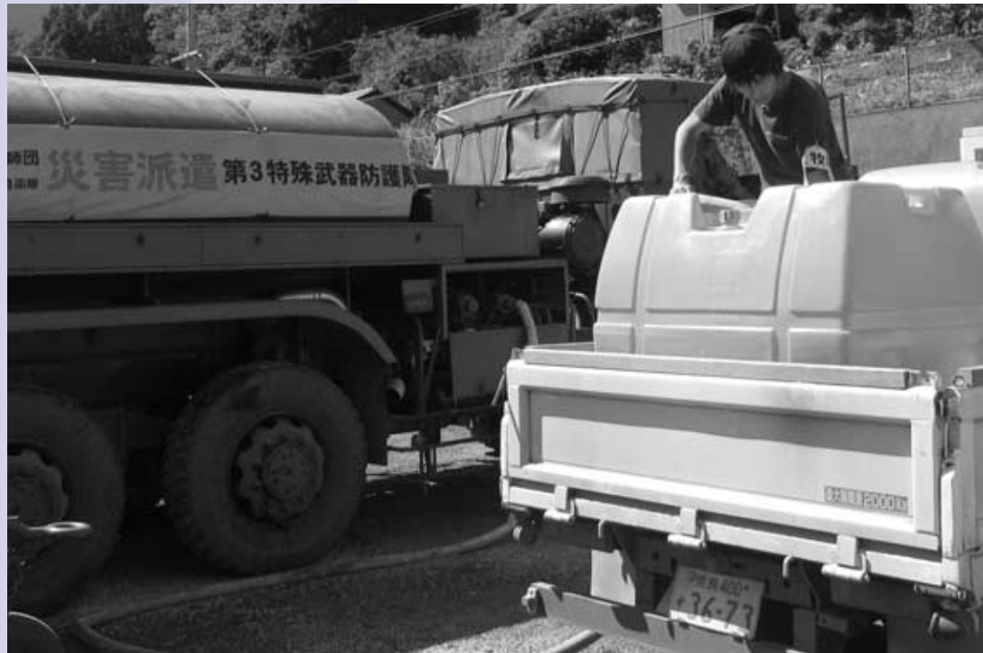
十津川村で給水活動を行う町職員