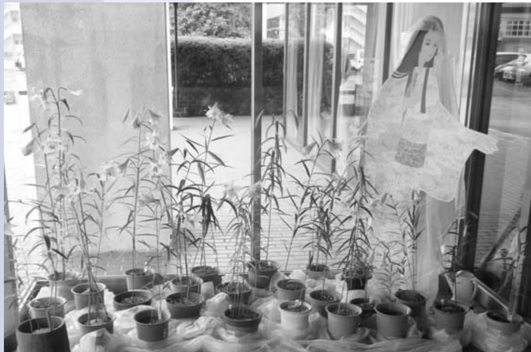
役場玄関を飾る笹ゆり