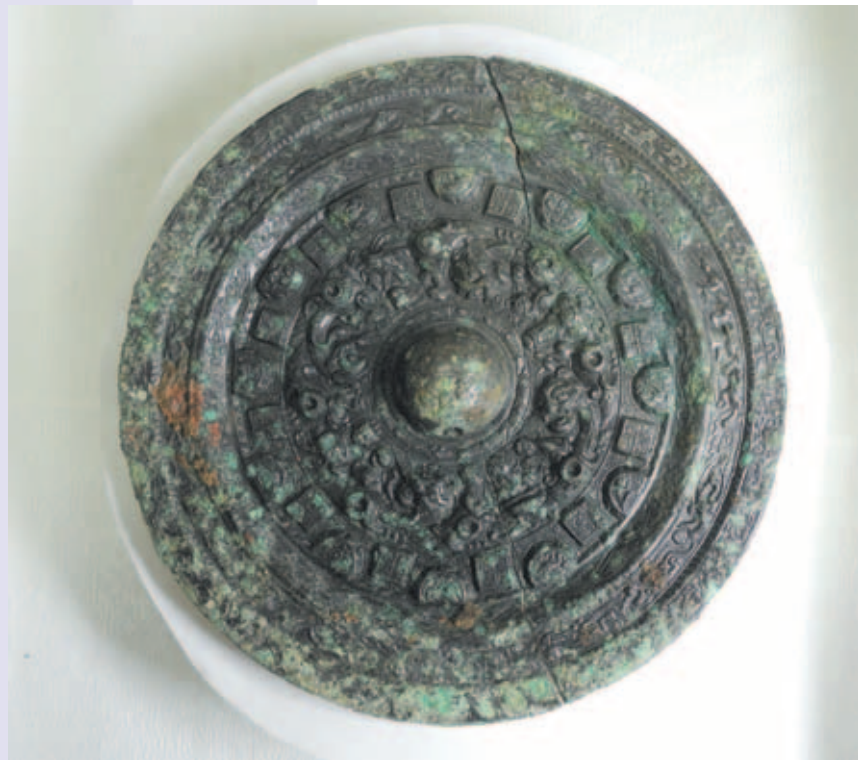
久渡古墳から出土した画文帯神獸鏡