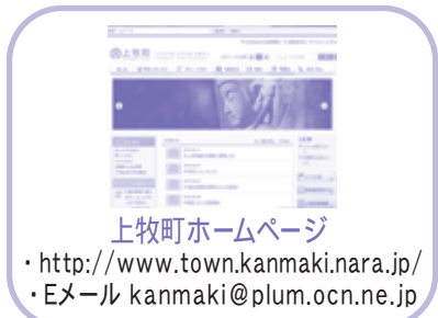
上牧町ホームページ

・ http://www.town.kanmaki.nara.jp/ ・ Eメール kanmaki@plum.ocn.ne.jp