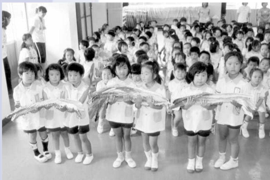
平和の祈りをこめて千羽鶴（上牧幼稚園）