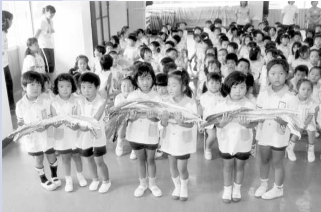
平和の祈りをこめて千羽鶴（上牧幼稚園）