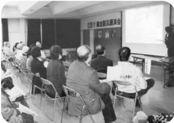
自主防犯・防災活動（自主防災講演会）

昨年度に補助の対象となった団体から事業の実績報告があり、上牧町公募型補助金審査判定委員会による評価・成果の検証の結果、全ての採択事業が評価できるものと認められました。