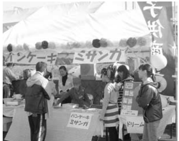
子供あきない塾（ペガサスフェスタ2012イベント）にて商品販売