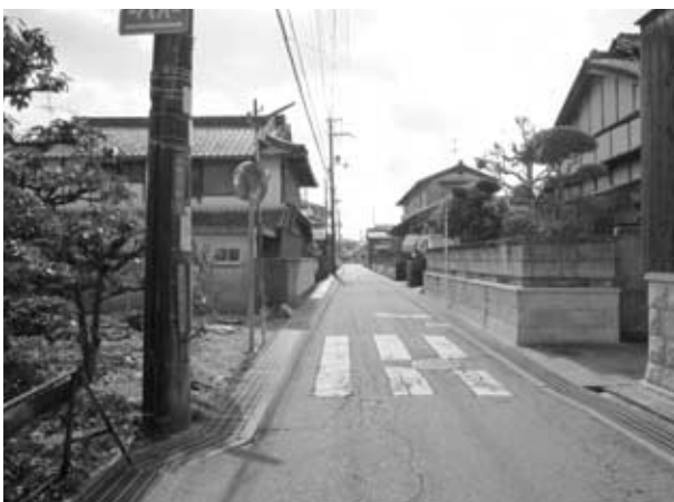
みんなでまちあるき（下牧3丁目地区の調査）