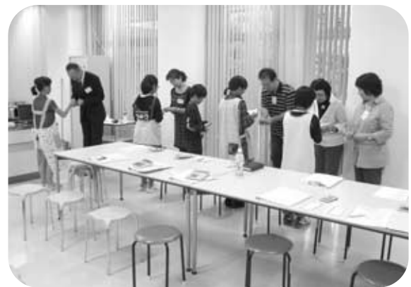
子供あきない塾（名刺交換の実演）