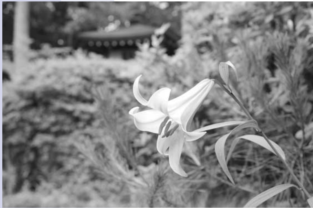
昨年さいた笹ゆり（浄安寺）