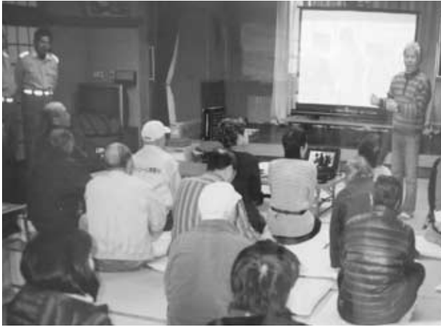
西大和六自治会連絡会主催の救急救命講習会