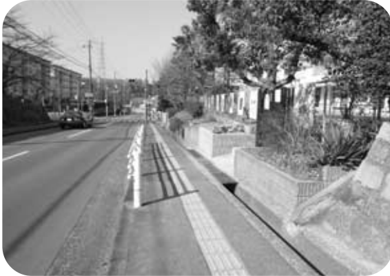
みんなでまちあるき（片岡台1丁目の調査）

昨年度に補助の対象となった団体から事業の実績報告があり、上牧町公募型補助金審査判定委員会による評価・成果の検証の結果、全ての採択事業が評価できるものと認められました。