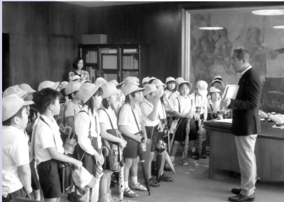
町長室見学 (第二小学校・3年生)