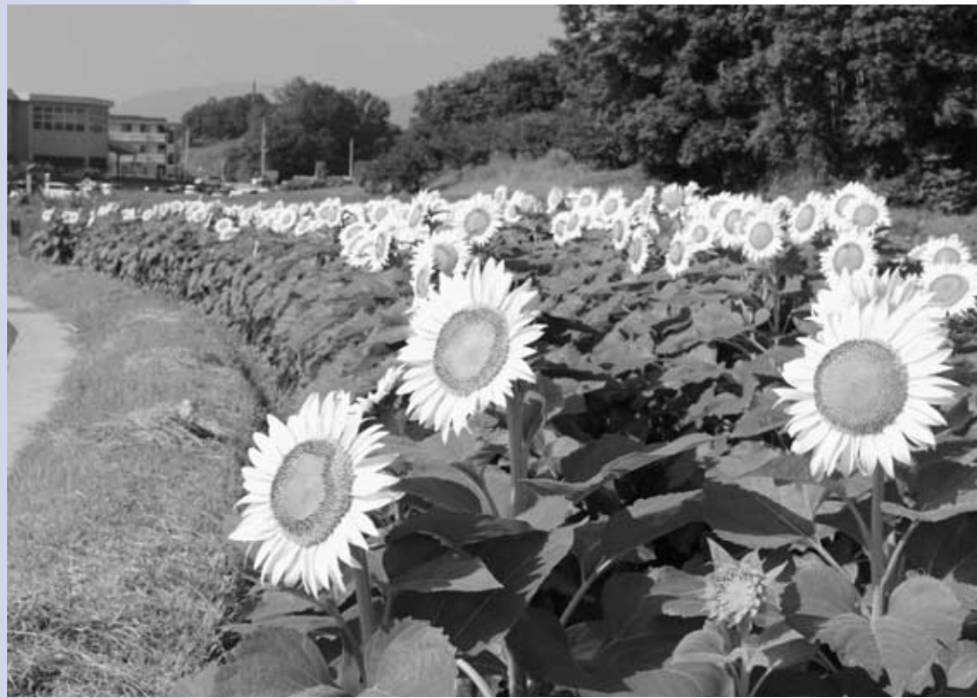
上牧町農業委員会で取り組んだひまわり栽培・キッズスマイル