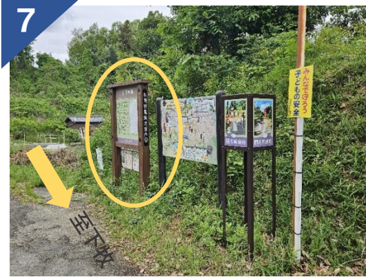
スポット①地蔵横看板に到着