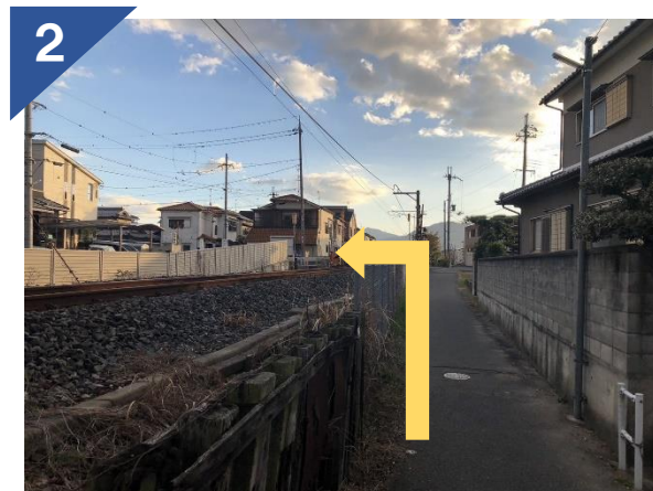
路地を抜けたら、左折して踏切をわたる