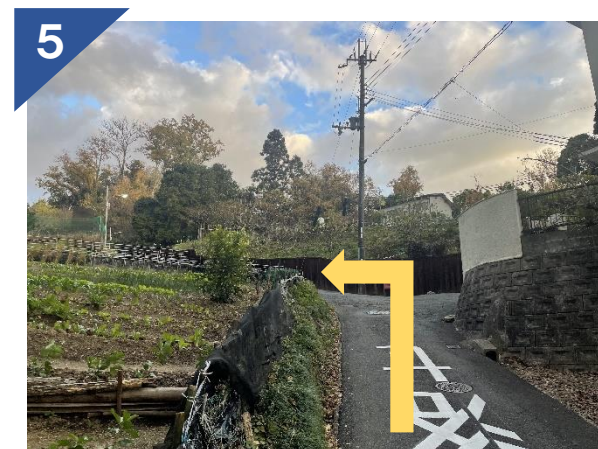
坂をのぼり、左方向へ進む