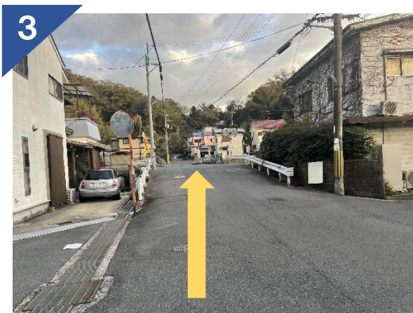
住宅街を直進する