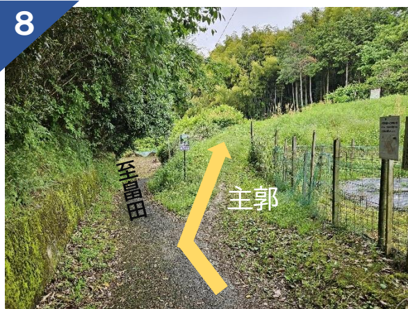
8 スポット②主郭へいく場合は、右方向へ進む