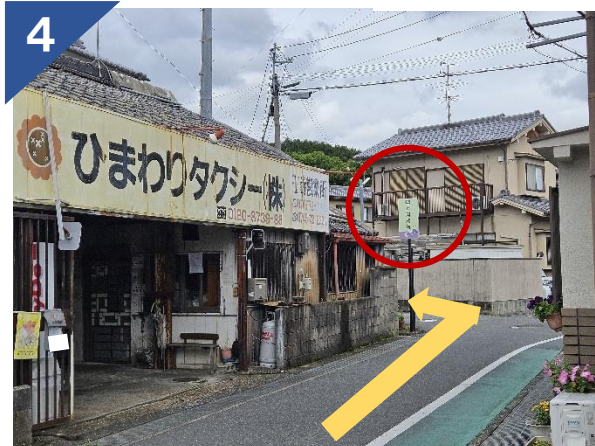
4 「ひまわりタクシー」の角を左折する