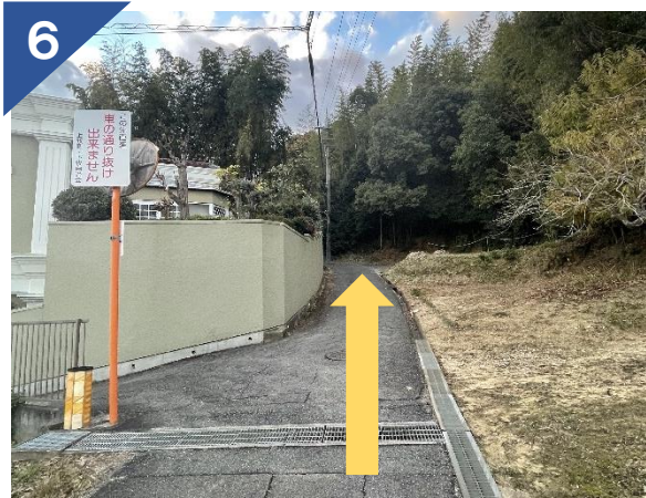
6 坂をのぼり、直進する