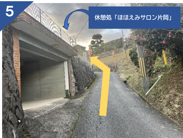
5 坂をのぼり、左方向へ進む