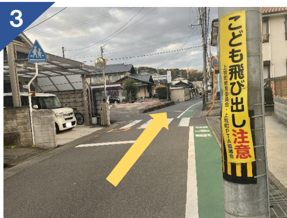
3 住宅街を直進する