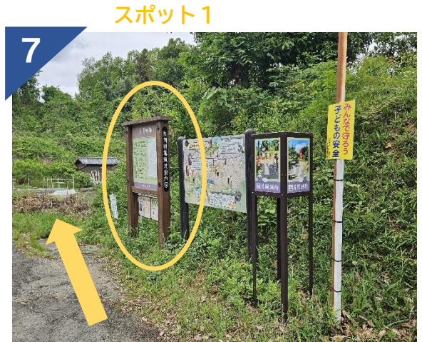
7 スポット1 スポット①地蔵前看板に到着 スポット②主郭へいく場合は、直進する