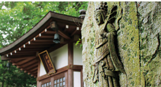
弁財天堂 お寺の由来に関わり、平家にもゆかりがあると(奥) いわれる弁財天が祀られています。

本尊は、木造阿弥陀如来坐像。境内には西国三十三カ所観音傍丘霊場があり、笹ゆりの姿を見ることができます。