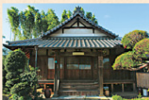
きょうえんじ 教円寺