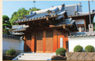
みょうせんじ 明善寺