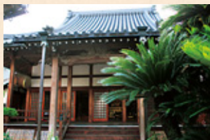
ねんがんじ 念願寺