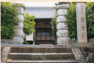
そうねんじ 宗念寺