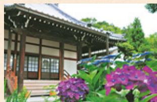
さくとくじ 即得寺