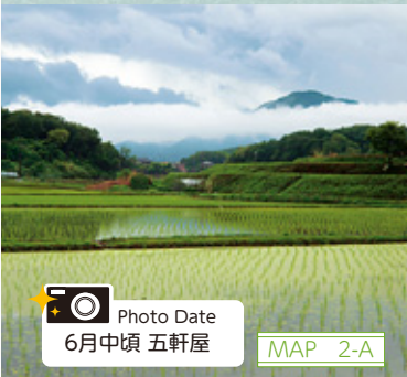
Photo Date 6月中頃 五軒屋