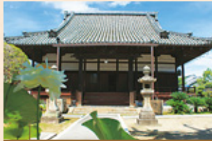
こうせんじ 光専寺