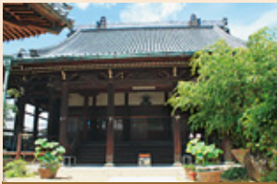
さいねんじ 西念寺