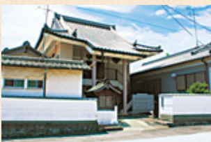
きょうしょうじ 教証寺