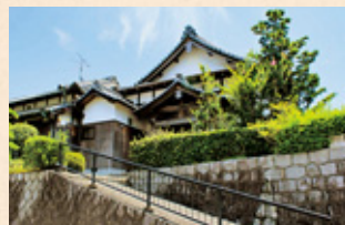
こうりゅうじ 光隆寺